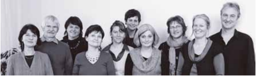
Team im Dezember 2010